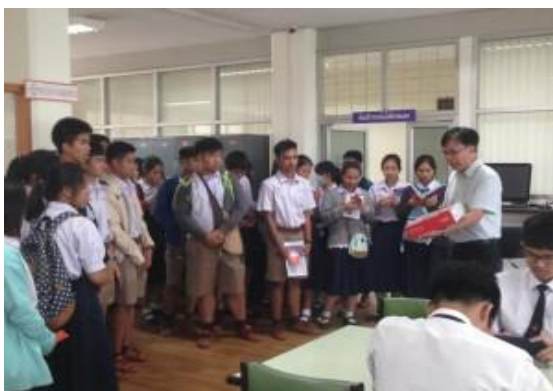
บริการนำชมห้องสมุดรูปแบบเดิม

ปัจจัยแห่งความสำเร็จ การคิดวิเคราะห์และข้อเสนอแนะเพื่อพัฒนางานทำให้ได้ระบบงานใหม่ที่ช่วยทำให้บริการนำชมห้องสมุดมีความเป็นสากล