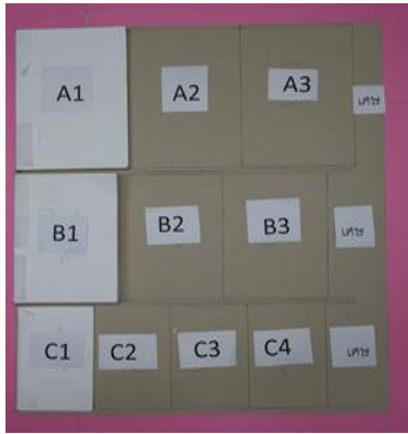
รูปที่ 1 ก่อนตัด