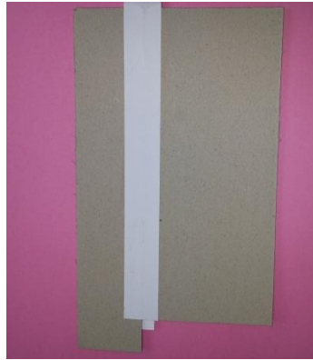
รูปที่ 2 นำเศษมาต่อกัน